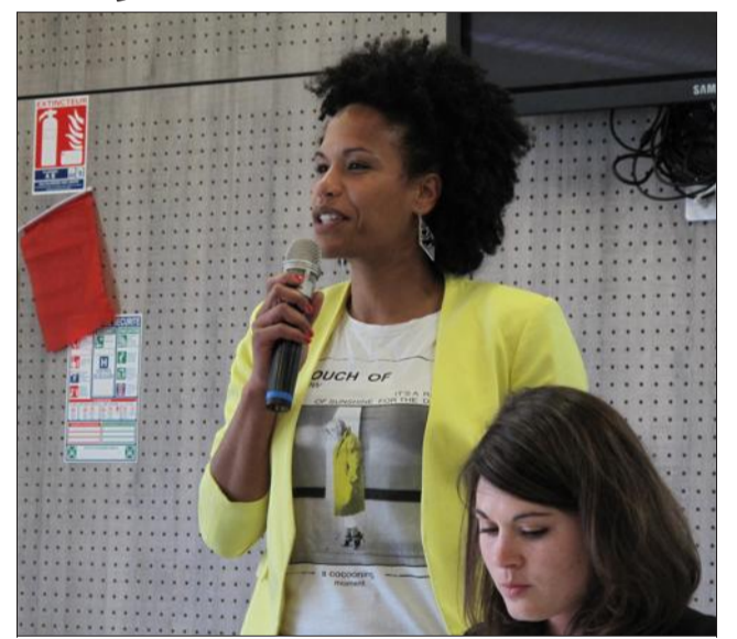
La marraine de l'opération, l'ancienne capitaine de l'équipe de France de handball, Amélie Goudjo, était présente pour partager son expérience.