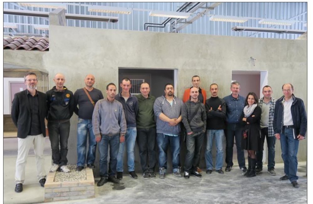
L'évaluation des stagiaires se fait pendant et à la fin de la formation. L'épreuve finale doit avoir lieu au mois de juin et sera déterminante pour leur certification.